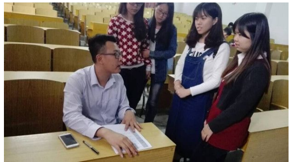
中国人民财产保险股份有限公司普宁分公司宣讲会现场及面试现场