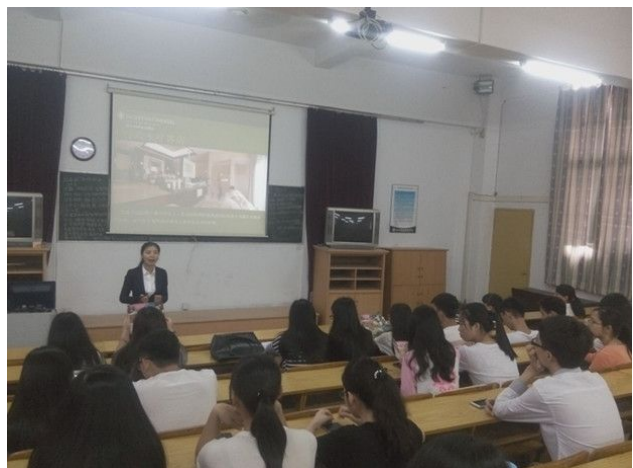
惠州市洲际国际度假酒店宣讲及面试