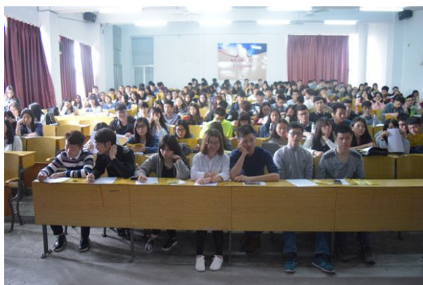
深圳市芭田生态工程股份有限公司宣讲会

6. 举办系列宣讲招聘会。为进一步搭建校企人才沟通合作平台，推进校企合作，做好毕业生就业推荐工作，拓宽学生就业渠道，给学生就业提供全面有效的服务，我办于4月份开始如火如荼地组织多场专场宣讲及招聘，为学院6月份举办大型招聘会预热。截止至4月27日，到校宣讲招聘的企业有深圳市芭田生态工程股份有限公司、迅销（中国）有限公司——优衣库、中国人民财产保险股份有限公司普宁分公司、惠州市洲际国际度假酒店等4家，共提供350多个实习就业岗位。