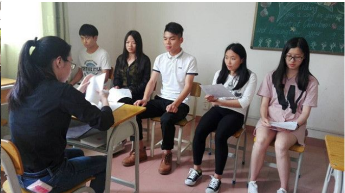
迅销(中国)有限公司——优衣库宣讲、 面试及培训现场